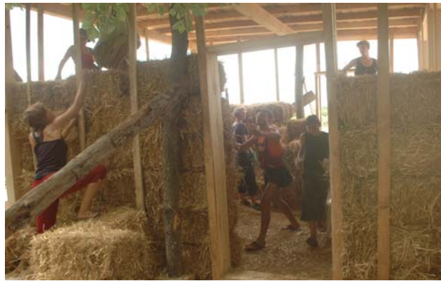
Balkan Ecovillage Network